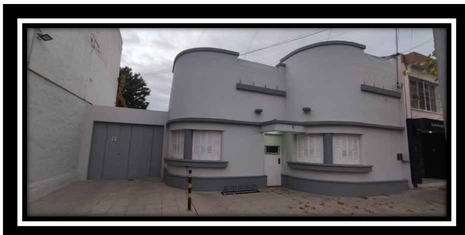
Fachada de como se ve hoy, luego de los trabajos realizados.