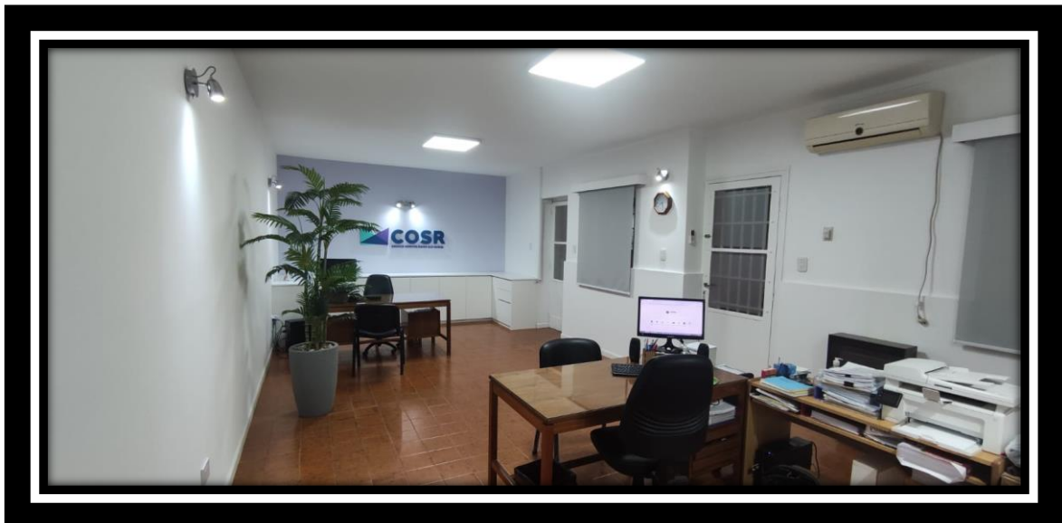
Imágenes de como están actualmente las instalaciones de Administración del C.O.S.R.