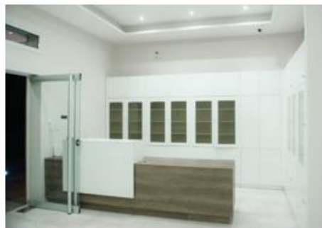
Nuevas y Modernas Instalaciones de la nueva sede