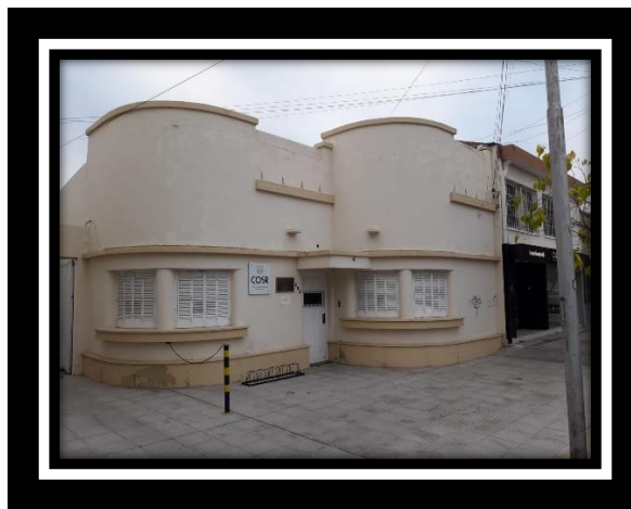
Fachada de la sede del C.O.S.R antes de los trabajos realizados en el mismo.

A continuación, compartimos una serie de imágenes que grafican los cambios realizados en el Círculo.