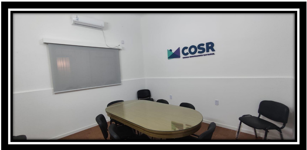
Imagen actual de como quedó terminada la Oficina de la Comisión Directiva, luego de los trabajos realizados.