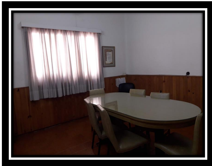
Vista de la oficina de la Comisión Directiva del Circulo